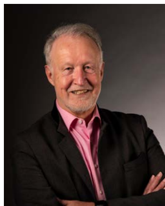
Roland Klenk Oberbürgermeister der Großen Kreisstadt Leinfelden-Echterdingen